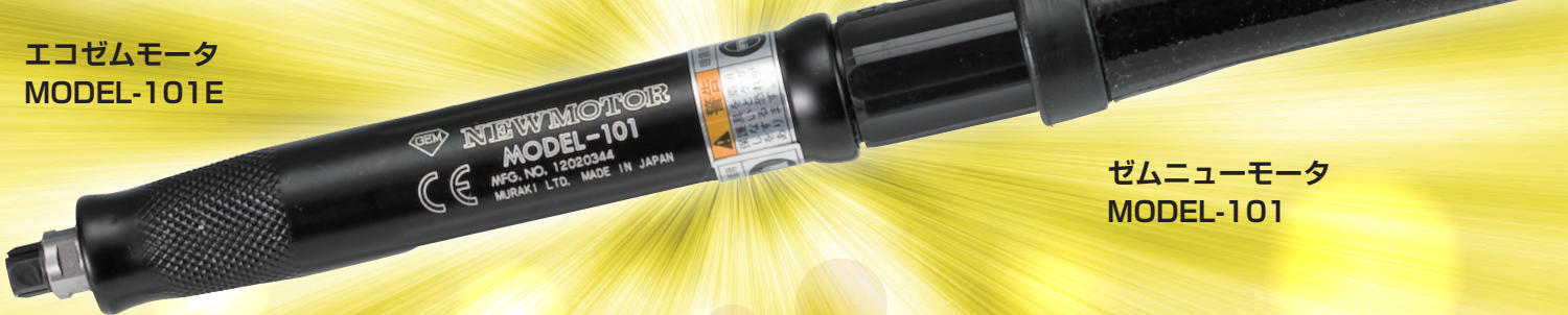
ゼムニューモータ MODEL-101

「エコゼムモータ MODEL-101E」 「ゼムニューモータ MODEL-101」 どちらか 1台 をご購入のお客様に