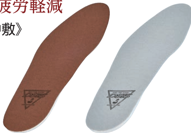
標準タイプ：ソルボ ヘルシーワークス 強力タイプ：ソルボ メディーワークス