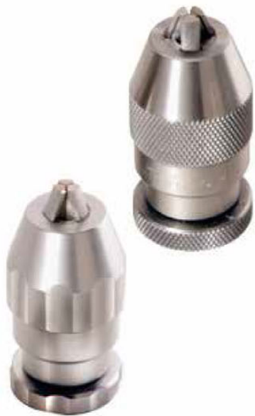
エルゴングリップ仕様※